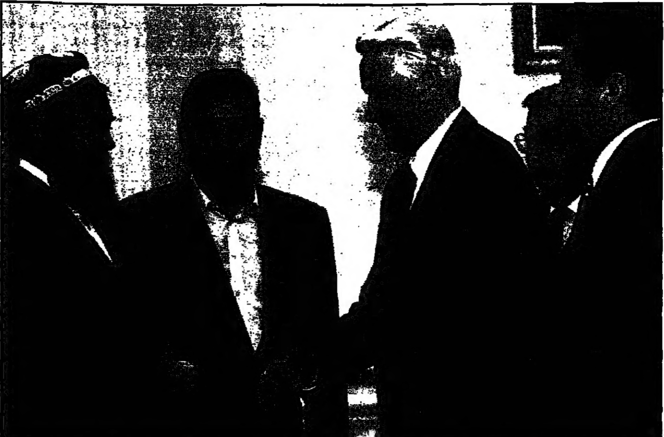
الرئيس الروسي يبريس يلتسين يوقع مع مسؤول عسكري إسلامي على اتفاق بين طرفي النزاع الطاجيكي (يمين)